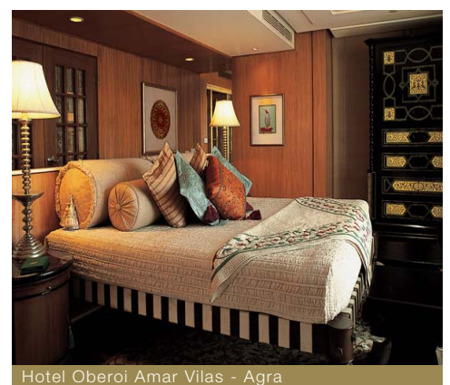
Hotel Oberoi Amar Vilas - Agra