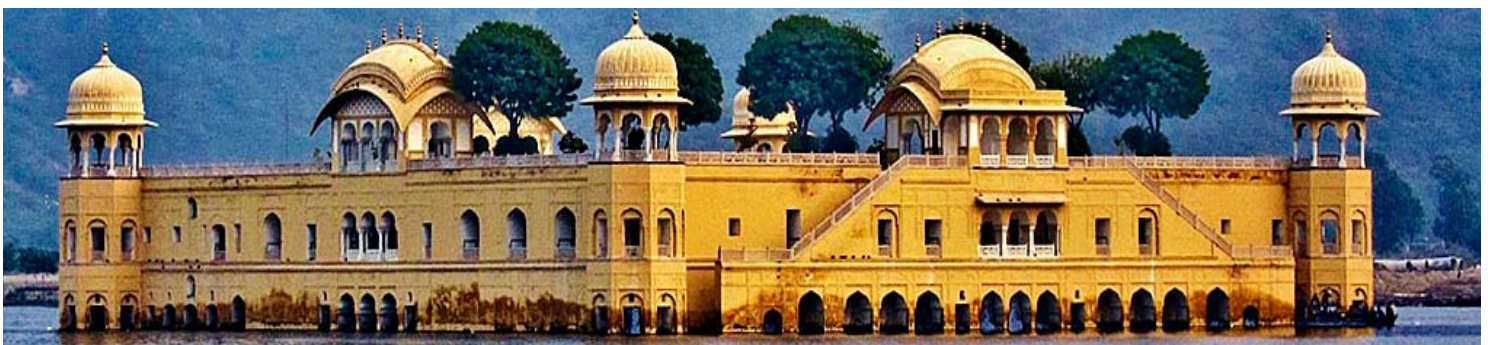
Jaipur - Palacio de Verano

Visado de India, ni de Nepal. Ningún gasto derivado de problemas ajenos a la organización. Gastos personales como comidas y/o bebidas no especificadas arriba, entradas de cámara, propinas, porta maletas, o cualquier otro gasto que no esté incluido en la cláusula "el viaje incluye".