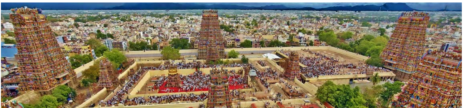
Vista aérea de Madurai

Vísado de India, ni de Nepal. Ningún gasto derivado de problemas ajenos a la organización. Gastos personales como comidas y/o bebidas no especificadas arriba, entradas de cámara, propinas, porta maletas, o cualquier otro gasto que no esté incluido en la cláusula “el viaje incluye”.