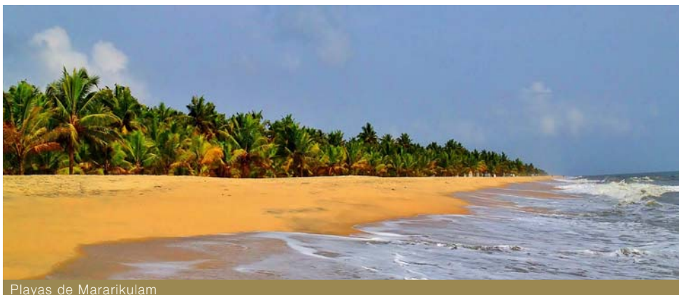
Playas de Mararikulam

Desayuno. Salida por carretera a Mararikulam, un pueblo situado cerca de bellísimas playas. En el camino tendremos la oportunidad de navegar por los Backwaters, una red de canales navegables. Estos canales se han utilizado durante siglos por la gente local para el transporte. Podrán observar un paisaje verde, precioso, con grandes extensiones de palmeras y de arrozales, y ver la forma de vida