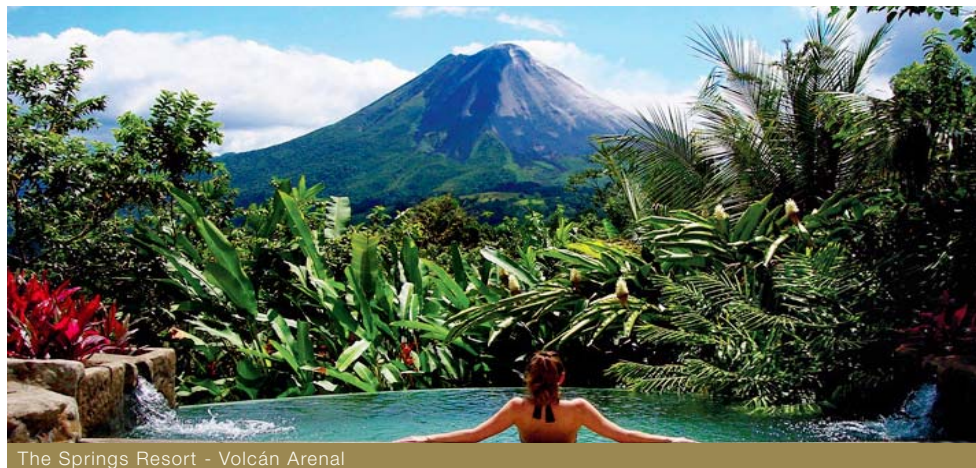
The Springs Resort - Volcán Arenal