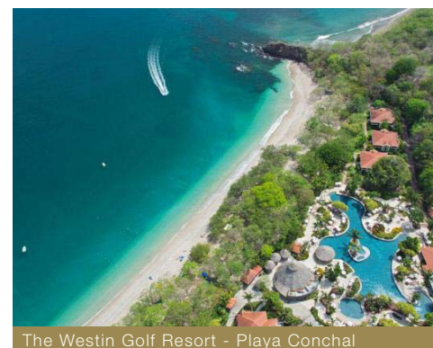
The Westin Golf Resort - Playa Conchal