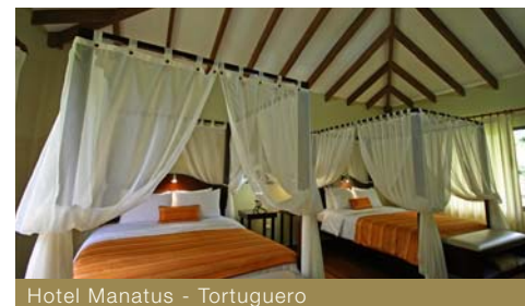
Hotel Manatus - Tortuguero