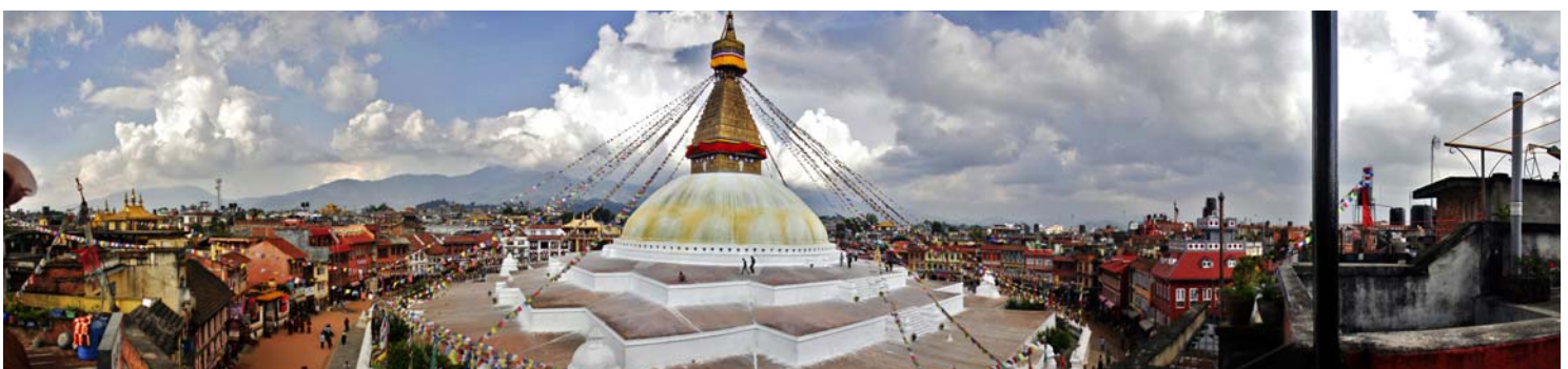
Katmandu - Estupa de Boudhanath

Visado de India, ni de Nepal. Ningún gasto derivado de problemas ajenos a la organización. Gastos personales, así como comidas y/o bebidas no especificadas arriba, entradas de cámara, propinas, porta maletas, o cualquier otro gasto que no esté incluido en la cláusula "el viaje incluye".