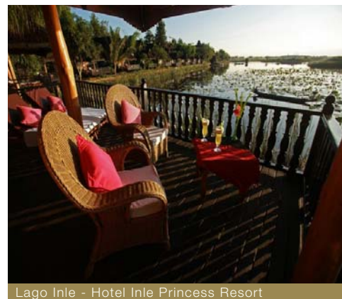
Lago Inle - Hotel Inle Princess Resort