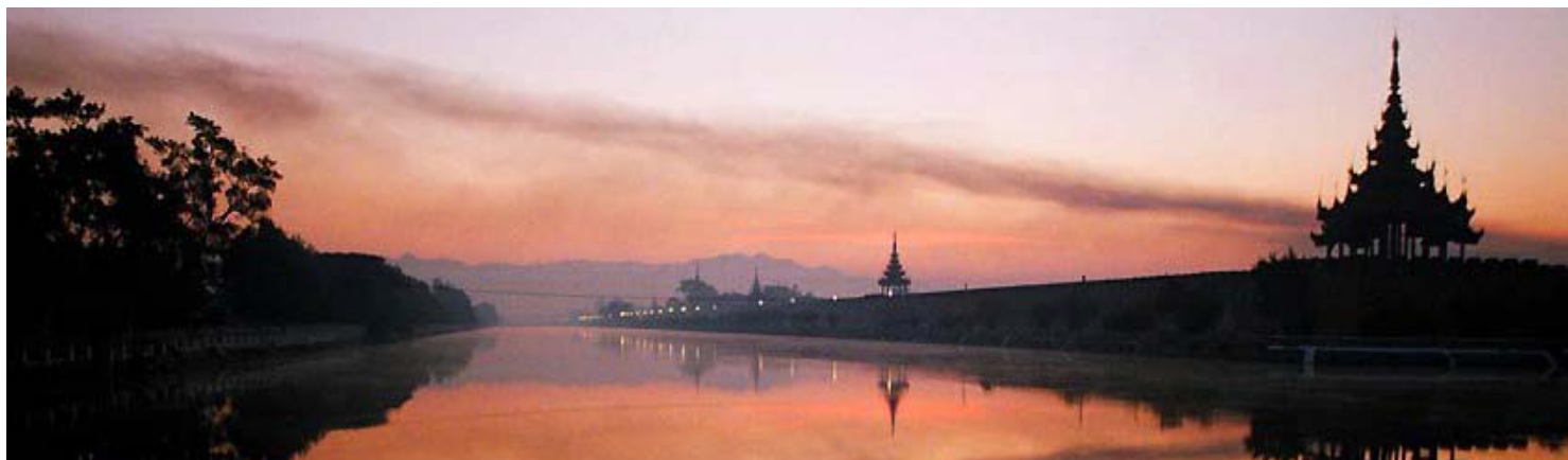
Mandalay - La Ciudad Prohibida

PARA CONOCER LOS PRECIOS DE ESTE PROGRAMA O DE CUALQUIER OTRA OPCIÓN, ROGAMOS QUE SE PONGAN EN CONTACTO CON NOSOTROS