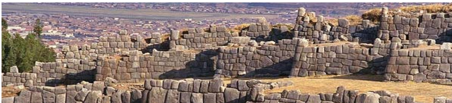
Fortaleza Ceremonial de Sacsayhuamán - Cuzco

PARA CONOCER LOS PRECIOS DE ESTE PROGRAMA O DE CUALQUIER OTRA OPCIÓN, ROGAMOS QUE SE PONGAN EN CONTACTO CON NOSOTROS