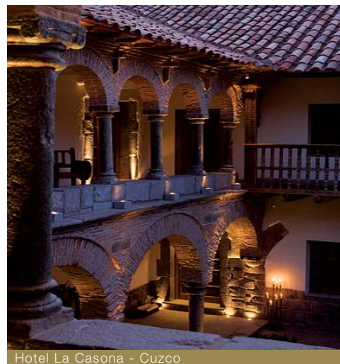
Hotel La Casona - Cuzco