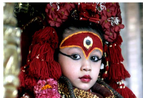
La Niña Diosa de Nepal, Kumari Real

Día 8 ESPAÑA Llegada y fin de nuestros servicios.