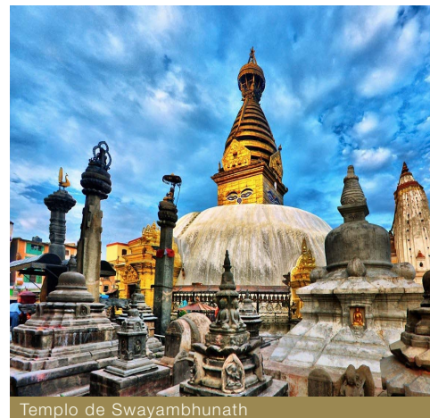
Templo de Swayambhunath