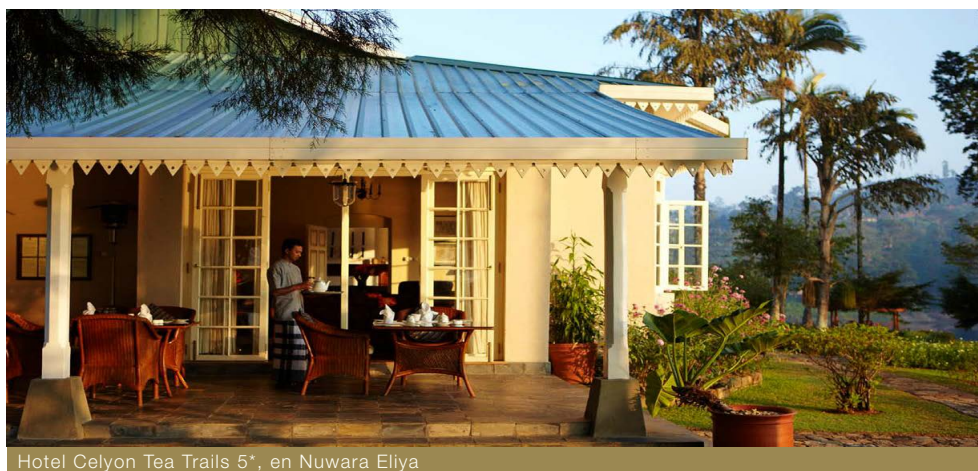
Hotel Celyon Tea Trails 5*, en Nuwara Eliya

Regreso, cena y noche en el hotel Earl's Regency 4*, en habitación Luxury.