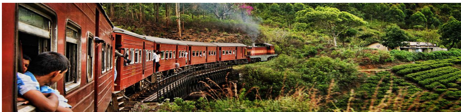
Tren de Nuwara Eliya

PARA CONOCER LOS PRECIOS DE ESTE PROGRAMA O DE CUALQUIER OTRA OPCIÓN, ROGAMOS QUE SE PONGA EN CONTACTO CON NOSOTROS